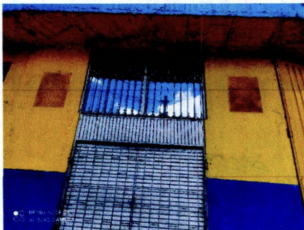
Dirección del local