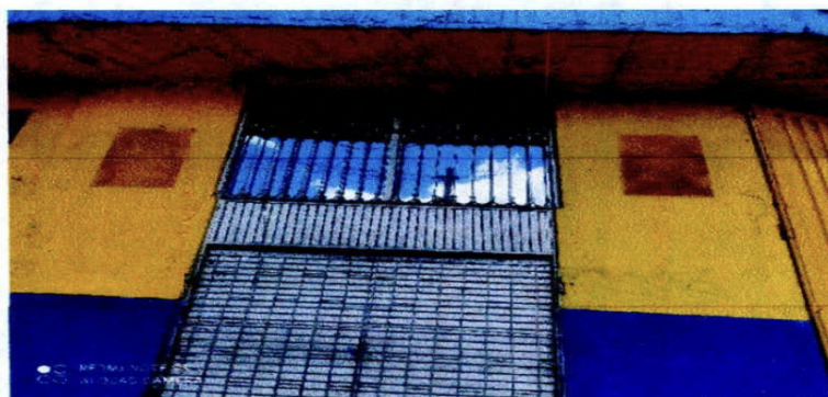
Dirección del local

“(…) me permito informarles que desde hace varios meses ya no esta en funcionamiento el establecimiento ubicado en la Calle 28 Sur No. 68 – 03 de la Localidad de Kennedy. También se retiro el aviso que se tenia como anuncio del mismo y que funcionaba como publicidad exterior. Al igual que se retiraron los anuncios que estaban cerca del mismo local aclarando que no me pertenecían. Estos anuncios estaban previamente allí. (…)”.